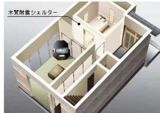
木質耐震シェルター