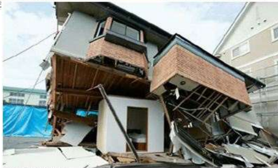
実験後の倒壊の様子 ※写真はイメージです。