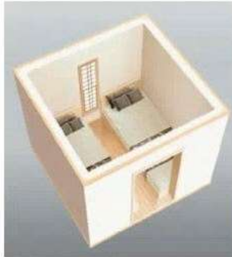
シェルター俯瞰イメージ