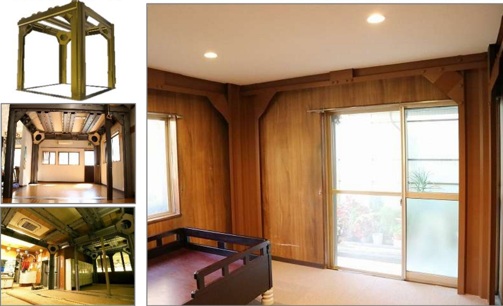
(床上トン置きタイプ) ※写真はイメージです。