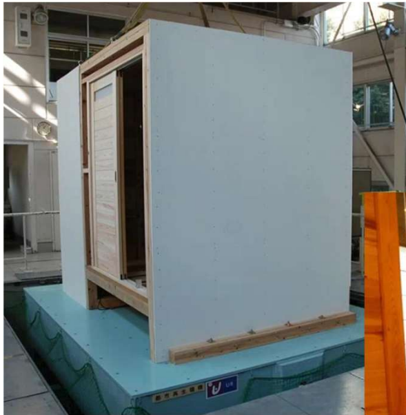
↑ 振動実験における装置全景