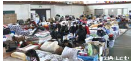
避難所生活をせないかんかも!?