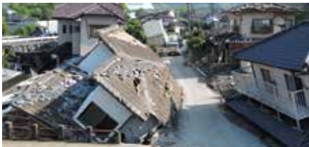
地震の揺れにより住宅が倒壊し、あなたや家族、ご近所さんが下敷きになったら!?