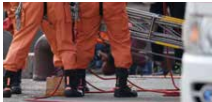
倒壊した建物のガレキで、救急車や消防車が通れなくなったら!?